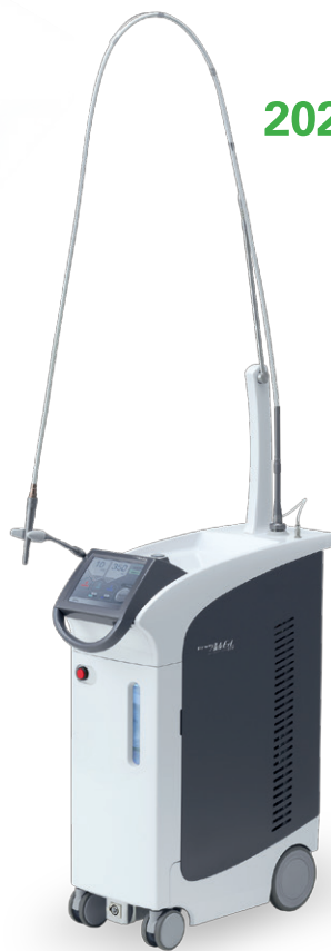
歯科用 Er:YAG レーザー装置 アーウィン アドベール EVO