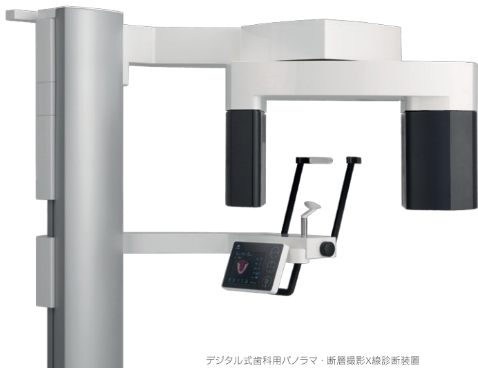
デジタル式歯科用パノラマ・断層撮影X線診断装置 ベラビュー X800