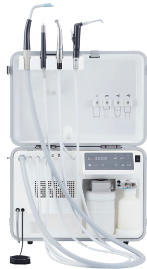
可搬式歯科用ユニット ポータキューブ+