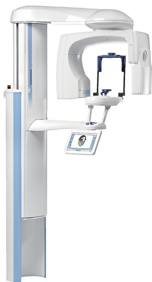
プランメカ ProMax® 3D