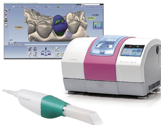
プランメカ Emerald™ プランメカ PlanMill® 30 S