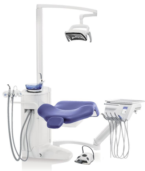
プランメカ Compact™ i5